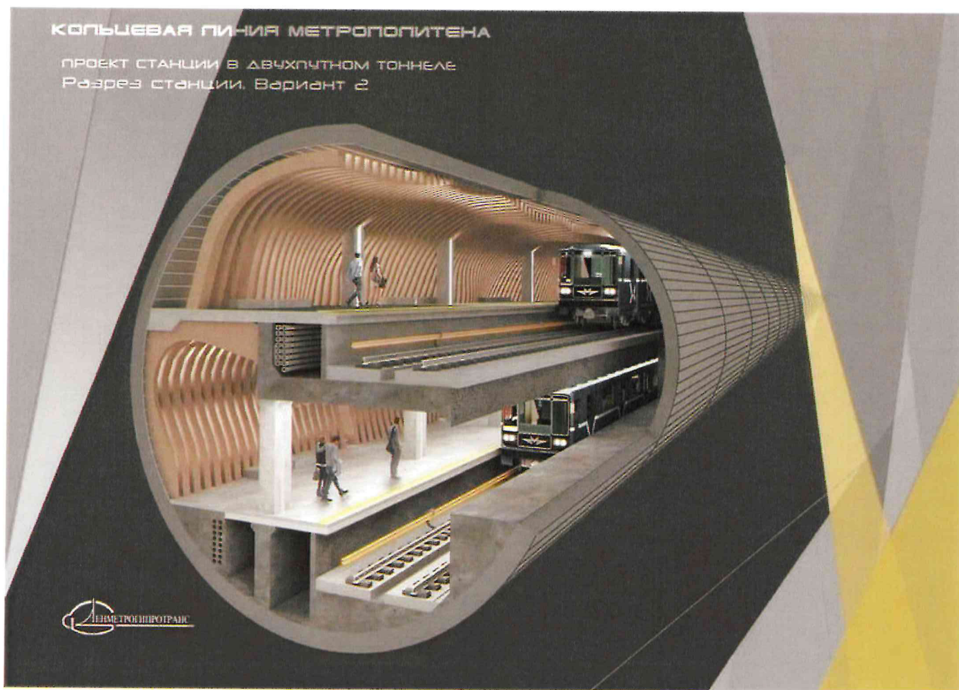
Станция в двухпутном тоннеле

Кстати, именно эта технология позволила ускорить строительство тоннеля и запустить станции к ЧМ-2018 – на полтора года раньше в сравнении с технологиями прокладки двух тоннелей. Продолжение Невско-Василеостровской линии также спроектировано двухпутным. Новый участок и новые станции предполагается создать еще более технологичными, комфортными и безопасными.