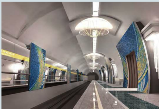
Проект станции метро «Театральная»

А ведь мы специально малыми порциями сдаем, потому что этот проект в числе приоритетных и экспертизу должен пройти с первого раза. Обидно: работаем – и все идет на полку. Сегодня на полках – четыре полноценных проекта линий метро: четыре разные линии, а не просто отдельные станции.